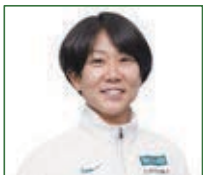
ゲストランナー 渋井 陽子さん

種目 2km 小学生(3年生以上)・一般(高校生以上) 10km 一般(高校生以上) 3km 中学生・一般(高校生以上) ハーフ 一般(高校生以上)