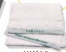
オリジナル今治スポーツタオル